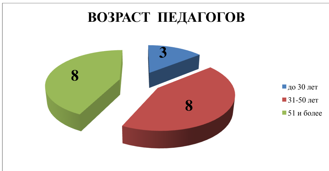
Распределение педагогических работников по возрасту, человек